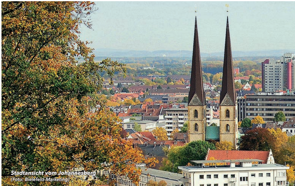
Stadtsicht vom Johannesberg

238. Marktmusik An der Beckerath-Orgel: Studierende der Musikhochschule Detmold