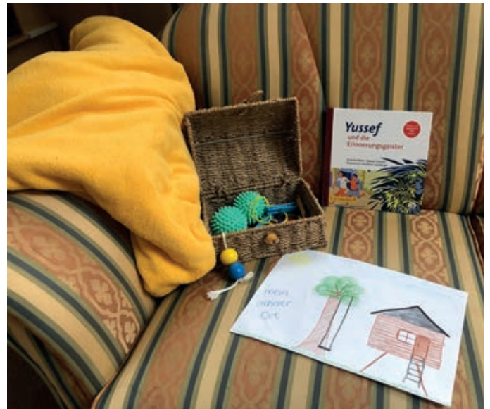
Eine gemütliche Ecke in der Fachstelle Trauma und Flucht der Diakonie für Bielefeld.

Die Fachstelle wird als sicherer Raum gestaltet: eine ruhige Umgebung, die Gemütlichkeit und Wärme ausstrahlt und das Gefühl: „Hier bin ich geborgen, hier werde ich beschützt und nicht angegriffen“.